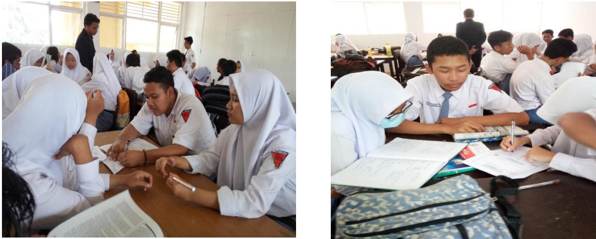
Gambar 2. Kegiatan Penyampaian Materi