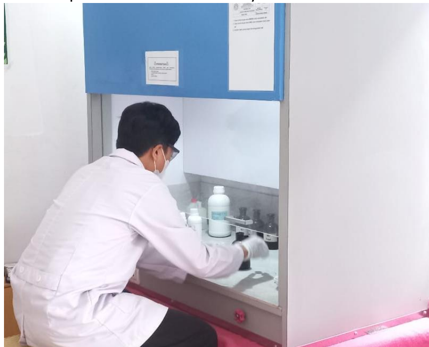
Gambar 3. Simulasi Kegiatan Penggunaan APD

Sebelum kegiatan berlangsung, sebagian siswa belum memahami fungsi masing-masing APD dan masih menganggap penggunaan APD hanya sebagai formalitas praktikum. Setelah diberikan demonstrasi dan penjelasan, siswa mulai memahami bahwa APD berfungsi melindungi tubuh dari paparan bahan kimia, percikan larutan, maupun risiko cedera lainnya.